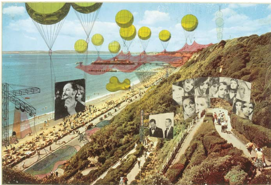
Fig. 2 : Peter Cook (Archigram), Instant City Visits Bournemouth, 1968, collection FRAC Centre, Orléans.

La spécificité du FRAC Centre est sa collection historique orientée vers les relations entre l'art et l'architecture prospective (fig. 2). Cette particularité nécessite donc une sensibilisation et une médiation adaptée à chacun et pour lesquelles l'oralité joue un rôle déterminant. Le FRAC Centre développe ainsi un programme de visites commentées s'adressant aux publics-cibles dans leur diversité et leurs particularités, mais également un programme culturel rassemblant tous les publics autour de l'art et de sa médiation.