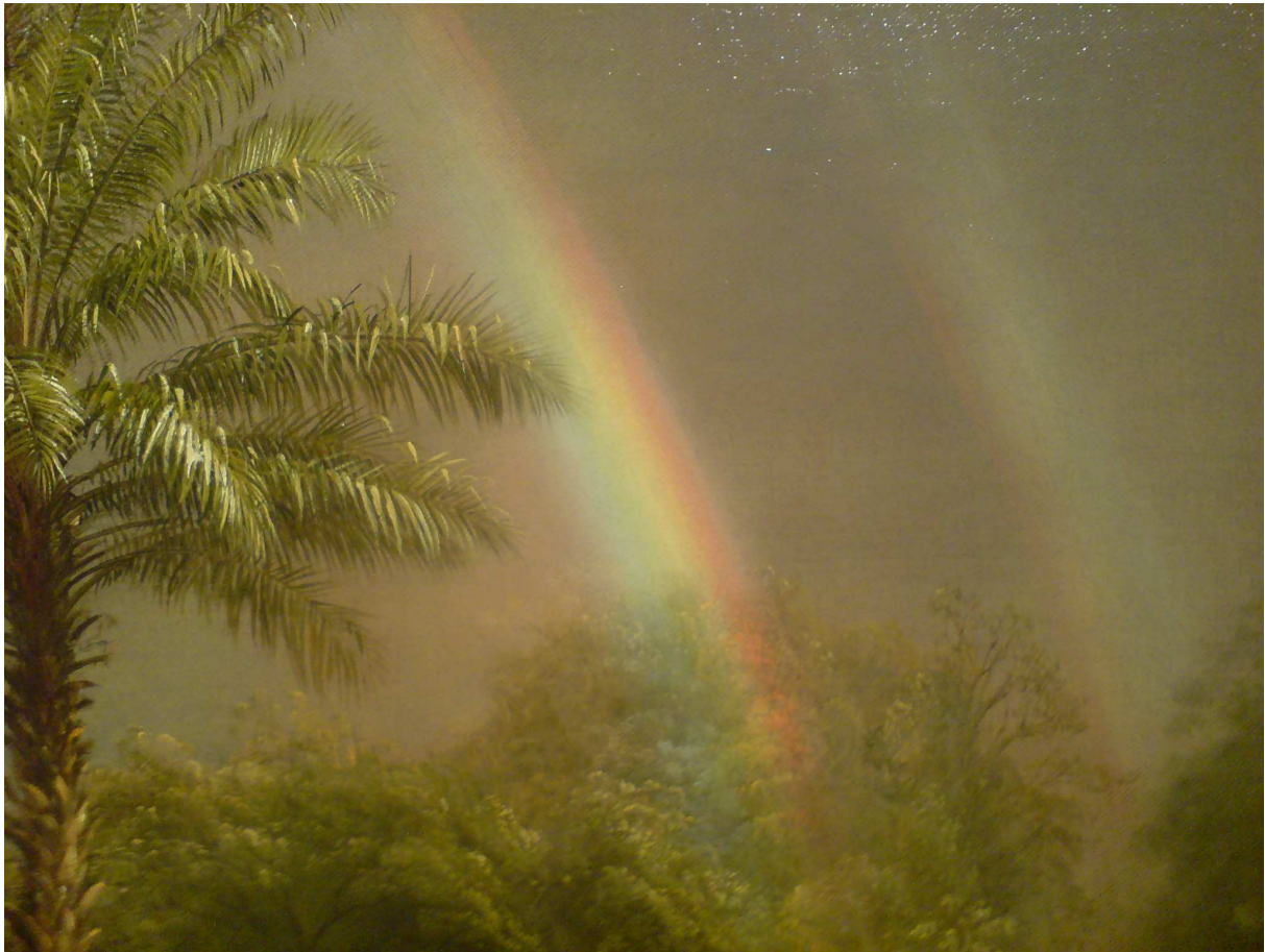
Frederick Edwin Church, Saison des pluies dans les Tropiques (détail), 1866

SCIENCES DE L'HOMME ET DE LA SOCIÉTÉ MENTION SCIENCES HISTORIQUES SPECIALITÉ HISTOIRE DE L'ART